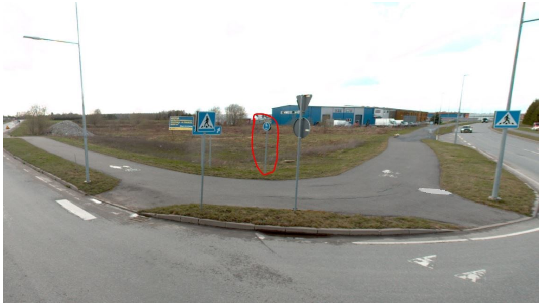
Joonis 3. Tänavavaade, likvideeritav olemasolev liiklusmärk