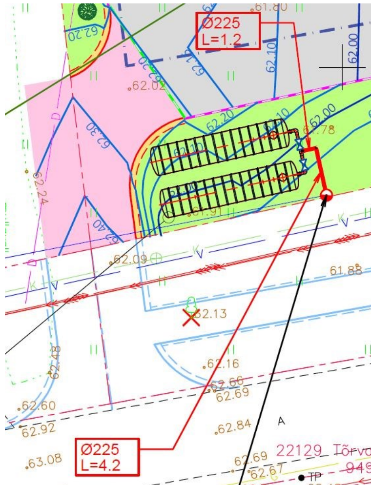
Joonis 5. Väljavõte vee- ja kanalisatsiooniprojekti asendiplaani joonisest nr VKV-4-01

haljasalal ning jääb päästetehnikaga ligipääsetavast teest rohkem kui 2,5 meetri kaugusele. Muuhulgas juhime tähelepanu, et jalg- ja jalgrattatee kasutamine päästetehnika juurdepääsuks ei ole lubatud, st juurdepääs tuletõrje hüdrandile tuleb tagada Rehepapi tee 39 kinnistule kavandatavalt platsilt.