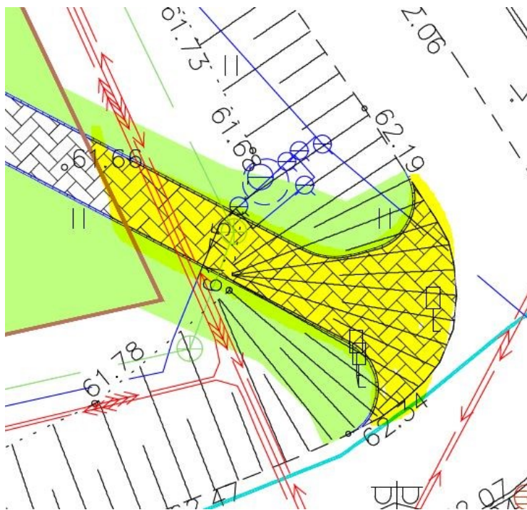
Joonis 4. Väljavõte teeprojekti joonisest nr TL-4-02